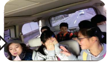
ほやほや号に乗り遅れ、急ぎよ自家用車での移動…