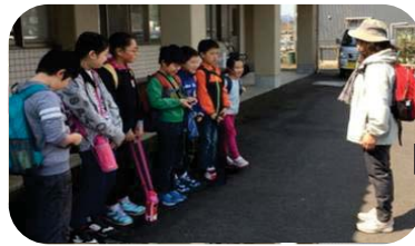
天気もよく、晴れ晴れとした出発式。

3/28(火)今年度の東っ子活動の集大成。清水東地区を拠点として利用できる公共交通機関を使い、越廼海岸へ行きました。今回は、ほやほや号を使いました。通常のバスの運行と違い、予約制で時間とバス停留所を電話で指定して、乗れます。値段も安く、思いのほか気軽に便利なので、皆様どうぞご利用ください。 大味海岸に到着し、海岸にある石や、漂流物を使って「ビーチコーミング・ビンゴ」「石の美術館」などの自然遊びをしました。