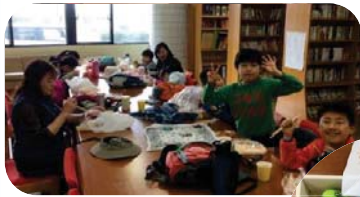
↑ 越廼公民館をお借りして昼食タイム。東っ子水族館、完成！！東公民館に展示中です。

その後、大味海岸から越廼公民館まで潮風を感じながら歩いて移動、越廼公民館で昼食をとり、海岸で拾ったものを空き箱の中に貼りつけ、「東っ子水族館」を完成させました。帰りは、ほやほや号に乗り、公民館に戻りました。天気もよく、波も穏やかで良い活動ができました。自然の中で無邪気に遊ぶ子供たちは姿を見て、これが子供らしい本来の姿なんだろうと感じました。