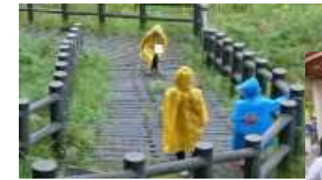
↑雨の中のウォークラリー

10月15日(日)雨模様となってしまったウォークラリー大会。参加者54人が13チームに分かれてポイントを回りました。第4回目とあってコツが分かっていたのかゴールの時間も早くなってきました。肌寒かったですが子どもたちは元気いっぱいでした。最後は子ども会育成委員さんが前日から作って下さったカレーを食べました。