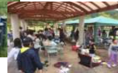
↓ウォークのあとにカレーを食べました。