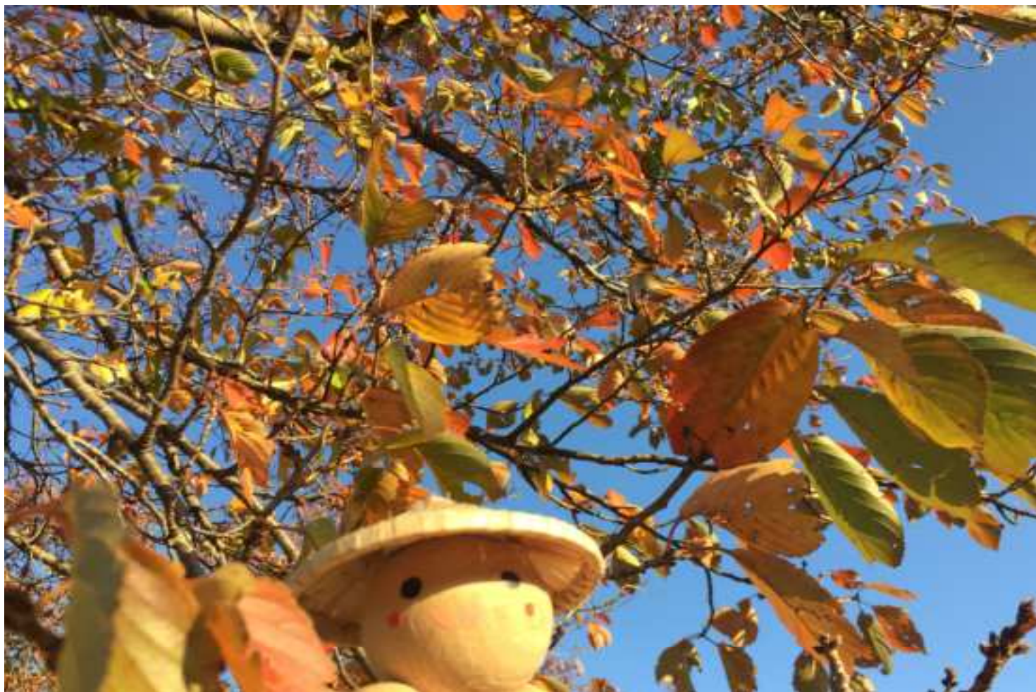
【今月のつばやき・桜の落ち葉】

●発行 清水東公民館 福井市三留町14-11-1 TEL(0776) 98-4510 ●メールアドレス sihiga-k@mx4.fctv.ne.jp