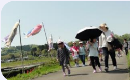
手づくりのピザ窯を作りピザ作り。遠赤外線焼き上げたピザは美味でした!

志津川の小羽ラブリバーまで、ウォーキング。こいのぼりを写生し、草花で色づけしました。こいのぼりは、子ども会育成会を中心に、地元竹を支柱に使用して立てています。