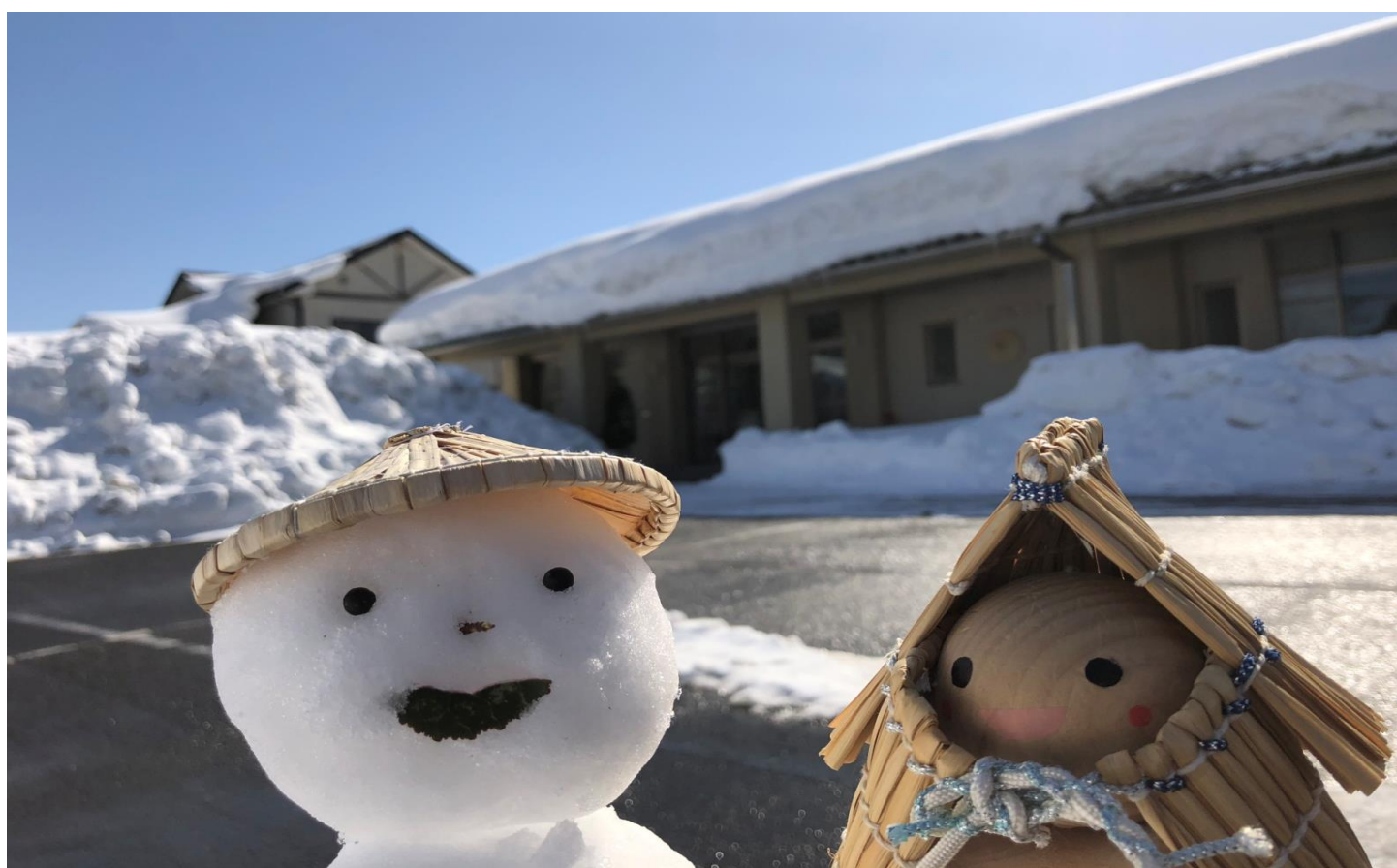
今月の写真：雪ん子すげちゃん &今年度初登場の笠雪だるま (2/14撮影)

●発行 清水東公民館 福井市三留町14-11-1 TEL(0776) 98-4510 ●メールアドレス sihiga-k@mx4.fctv.ne.jp