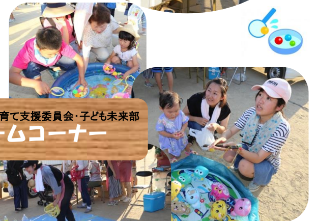
清水東地区子育て支援委員会・子ども未来部 ゲームコーナー