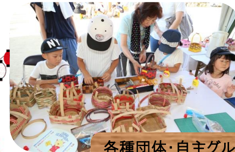
各種団体・自主グループによる 展示・販売・体験コーナー