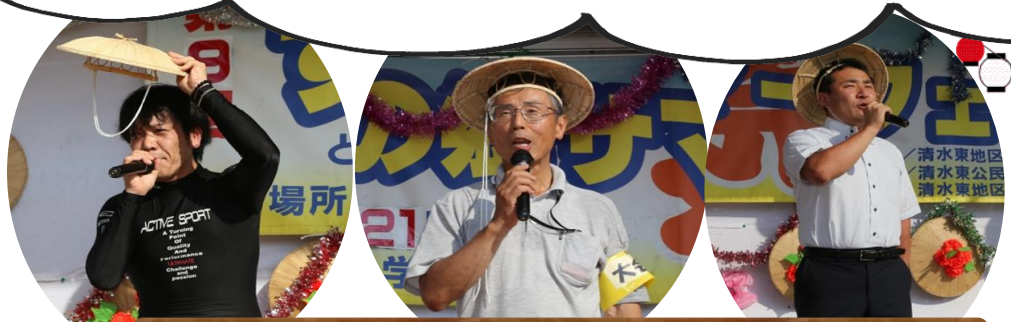
開会宣言・大会長挨拶・来賓挨拶