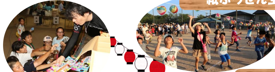
清水東地区子ども会育成会 子ども花火