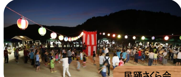
民踊さくら会 すげ笠総踊り