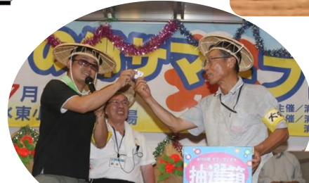
清水東地区自治会連合会 お楽しみ抽選会