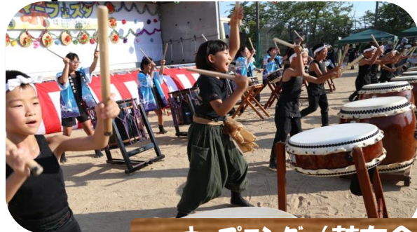
オープニング（鼓友会・くいのみ児童館）