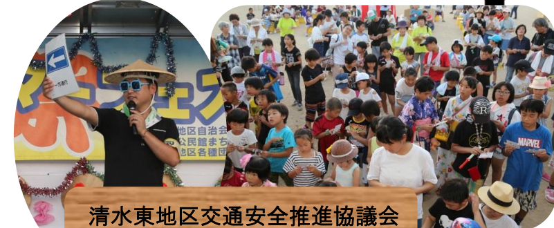
清水東地区交通安全推進協議会 交通安全ビンゴ