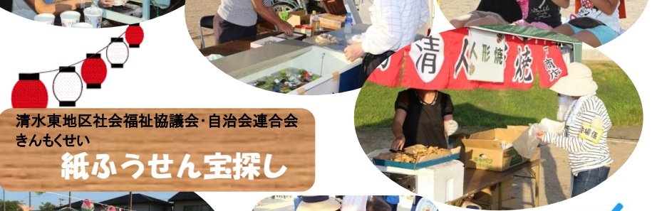
清水東地区社会福祉協議会・自治会連合会 きんもくせい 紙ふうせん宝探し