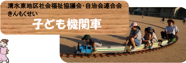
清水東地区社会福祉協議会・自治会連合会 きんもくせい 子ども機関車