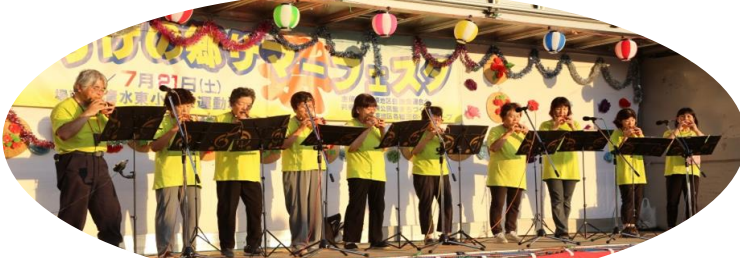
自主グループ発表 コカリナアンサンブル・ひがし