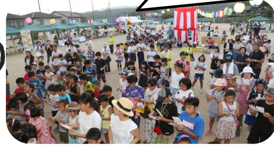
サウルコス福井 ふれあいイベント