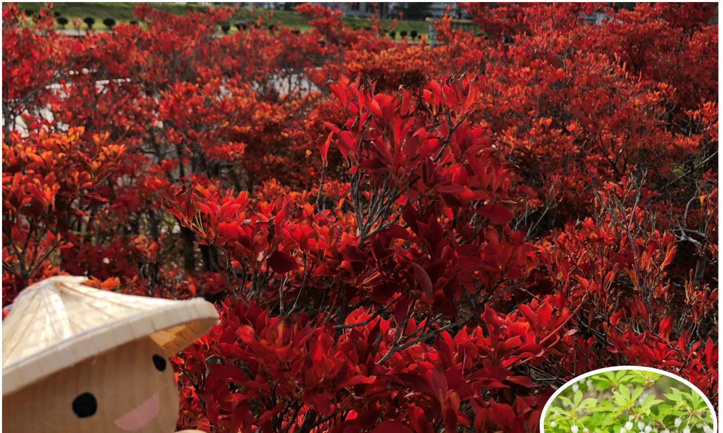
今月の写真：すげちゃん & ドウダンツツジ in小羽ラブリバー 11/13撮

●発行 清水東公民館 福井市三留町14-11-1 TEL(0776) 98-4510 ●メール以 sihiga-k@mx4.fctv.ne.jp