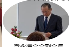
宮永連合会副会長