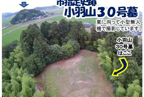
四角いお墓の形がわかりますでしょうか。