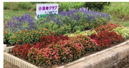
↑ 最優秀賞 小羽寿クラブの花壇