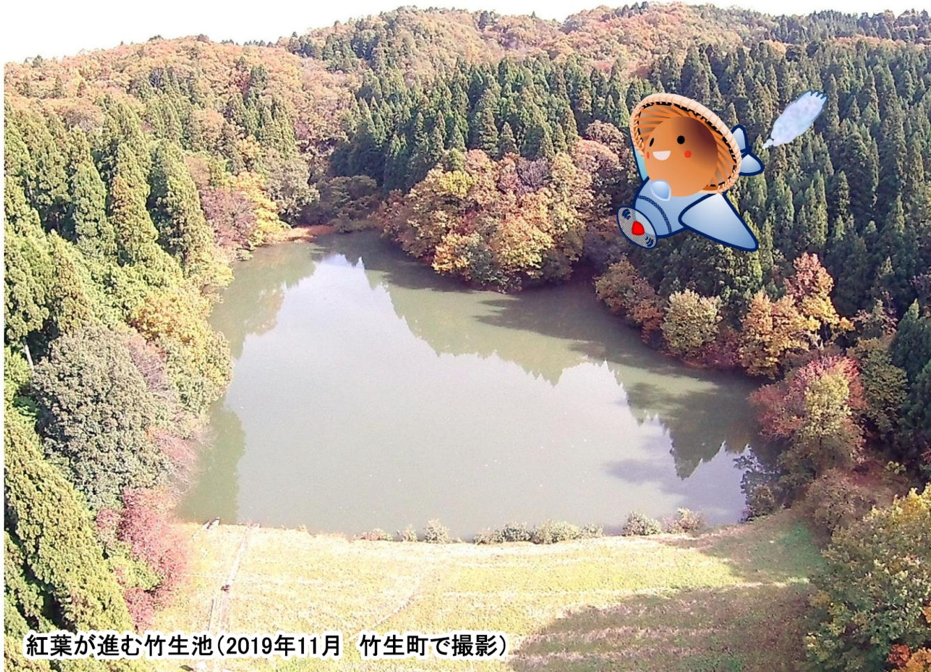
紅葉が進む竹生池(2019年11月 竹生町で撮影)

●発行 清水東公民館 福井市三留町14-11-1 TEL(0776) 98-4510 ●メールアドレス sihiga-k@mx4.ftv.ne.jp