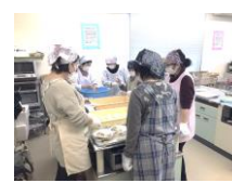
お餅のお持ち帰り