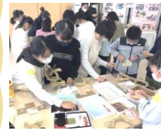
児童や保護者の方たちの力作です

ふるさと環境部の方々にしめ縄を作っていただきました。飾りは、南天や紙垂(して)・水引子ども会育成会の方々が紙粘土で花などを準備していただきました。思い思いの飾り付けて、どれも素晴らしいしめ縄飾りができました。