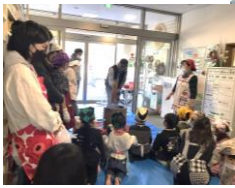
ちびっこのもちつき体験の様子