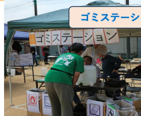
ゴミステーション