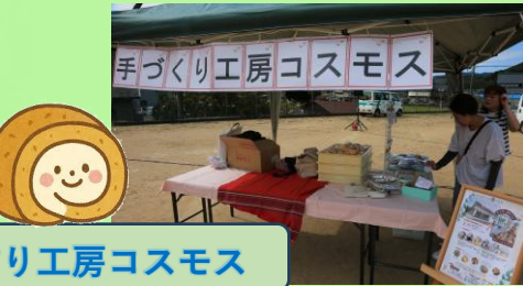
手作り工房コスモス