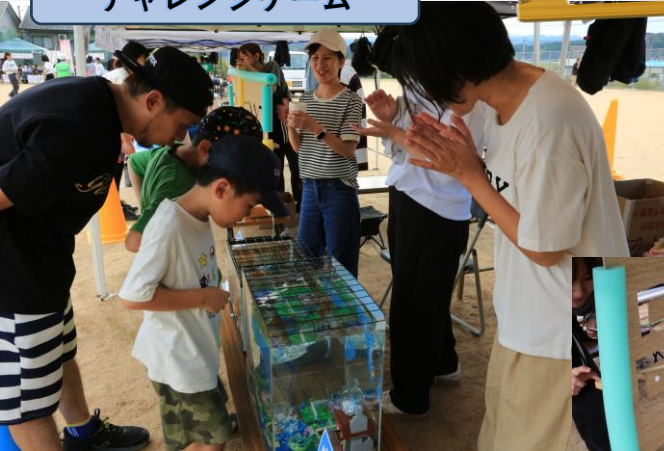
チャレンジゲーム